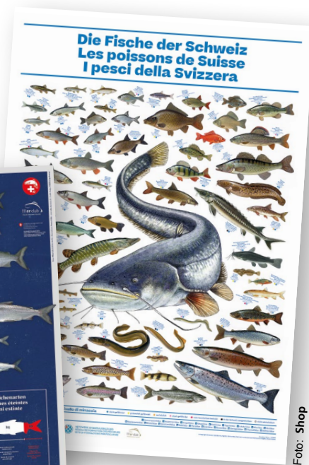
Die beiden neuen Poster.